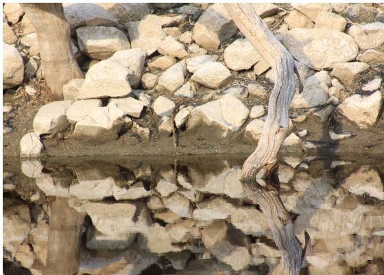
[ Ritme – Fotografie Annemiek van Vliet]

compositie en dwingen haar de camera ter hand te nemen ten einde het moment te consumeren AS IS . Ze speelt zonder al te veel na te denken met de tegenstelling tussen licht en donker en heeft veel gevoel voor compositie. Ze zoomt in op details die ze daarna opblaast, verheffend tot iets bijzonders. De expositie laat de door haar gevangen momenten zien, ademtochten van een wereld die met het blote oog nauwelijks waarneembaar is.