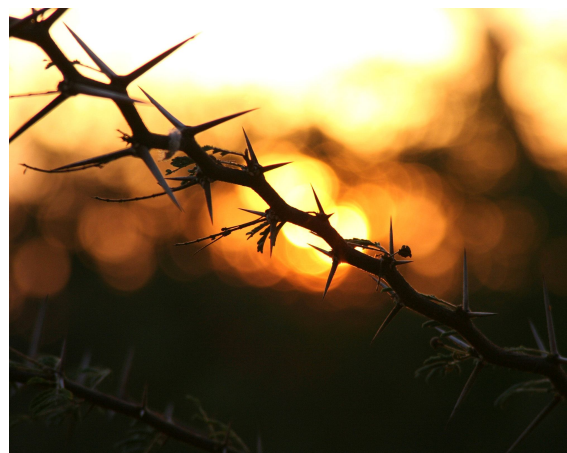
[ Mens en natuur]

Er duikt een verhaal op achter een muur vol ritme, de details van daken nemen je mee terug in de tijd en een zonnebadend krot wordt plotseling een levend wezen waarvan de vitaliteit onoverwinnelijk blijkt. De ziel van het object waar ze zich op richt heeft nauwelijks kans om te ontsnappen aan haar lens.