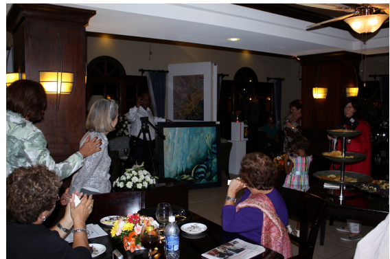
[ Tara Suites ]