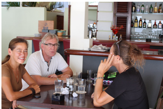
[ KulturA op Bonaire ]

vormgeving en bouwkunst, Mondriaan Stichting, Nederlands Fonds voor Podiumkunsten, Fonds voor Cultuurparticipatie, Fonds voor de Letteren en Nederlands Literair Productie- en Vertalingenfonds. De KulturA-regeling is een aanvulling op de reguliere ondersteuningsmogelijkheden van deze fondsen. Eerder dit jaar, in april, reisde een delegatie voor het eerst naar de Antillen. De medewerkers bezochten een aantal culturele instellingen, kunstenaars en beleidsbepalers om hen te informeren over de mogelijkheden bij KulturA. Ook vond er op elk eiland een centrale informatiebijeenkomst plaats voor iedereen die geïnteresseerd is in KulturA en de overige activiteiten van de fondsen.