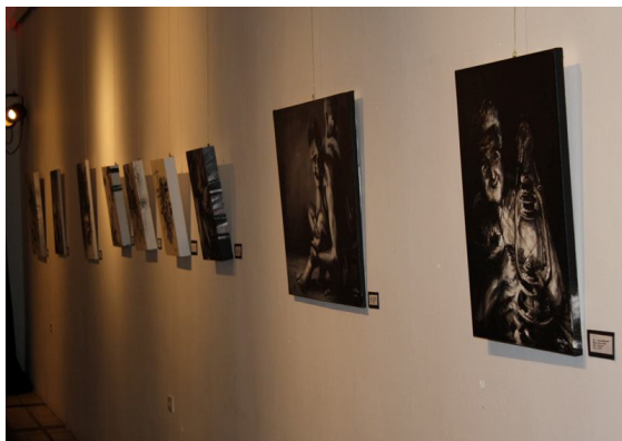
[ De kunstwerken op een rij ]

Het is doodstil in de zaal. Niets beweegt. Aan de vier lange witgeschilderde muren van de expositieruimte hangen rijen schilderijen geduldig te wachten op de bezoekers, die buiten al glimpen proberen op te vangen van wat komen gaat. De zwart-wit kunstwerken van Arte den tempo di Crisis geven de majestueuze stilte een geladenheid die bijna tastbaar is. De doeken lijken de stilte nog stiller te maken, een eerbiedige houding van de kijker afdwingend. Het minimale kleurgebruik onderstreept de ernst van het onderwerp.