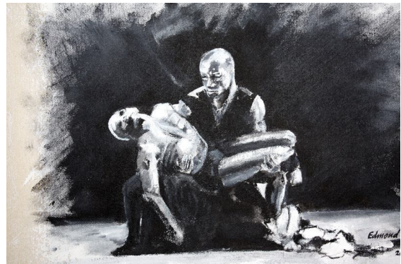
[ BROTHERLY SORROW van Edmond Tujeehut ]

Tujeehut bracht Crisis heel fraai tot uitdrukking in Earth crack , een tweeluik dat ondanks zijn donkere uitstraling eerder een hoopgevend beeld geeft dan een depressief. Doordat de kloof horizontaal over de gehele doeken loopt geeft het de kijker de gelegenheid twee kanten op te denken, zowel naar links als naar rechts, zonder zich iets aan te trekken van de verticale onderbreking. Op het moment van een dreigende crisis is oplossingsgericht denken een belangrijke vaardigheid om niet gevangen te raken in chaos. Links kan symbool staan voor verleden, waar de oorzaak van de crisis ligt terwijl rechts symbool staat voor de toekomst, daar waar de oplossing kan worden gevonden.