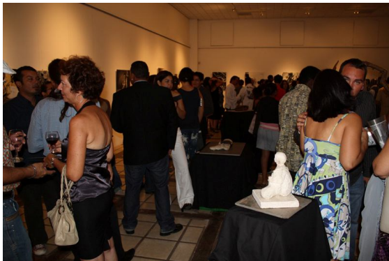
[ Een druk bezochte opening ]

Behalve de dure ruimte, een catalogus en PR, vormen de materialen en tijd die het kost om een expositie op te zetten vaak al een crisis op zich. Een kunstenaar wil zich eigenlijk liever niet met dit soort aardse dingen bezighouden, maar eendracht maakt macht en ineens was het zover dat Crisis het daglicht mocht zien.