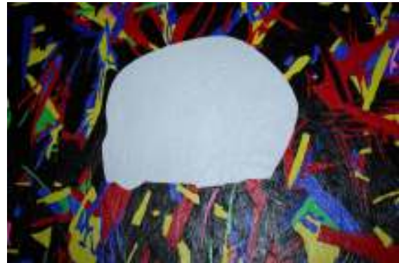
[ Kunstwerk van Lorenzo Guold ]

een toenemende vergrijzing. Van de 80-plussers in Nederland lijdt 30% aan een vorm van dementie. Alzheimer is een van de bekendste vormen van dit groeiende geheugenverlies en het daarmee gepaard gaande verlies van structuur en oriëntatie.