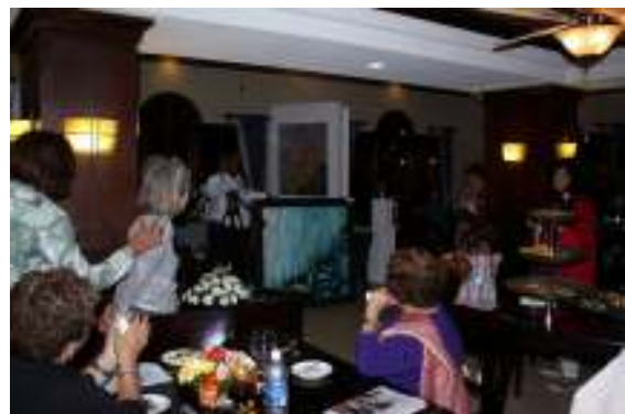
[ Tara Suites ]