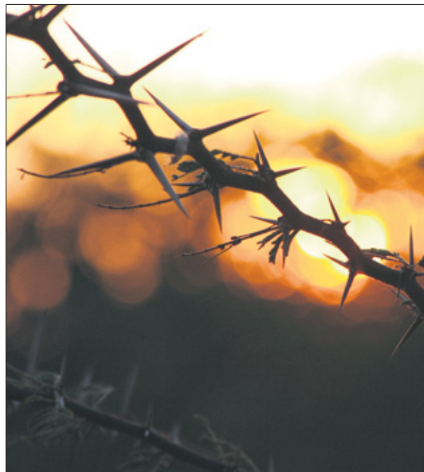
De mens en de natuur.