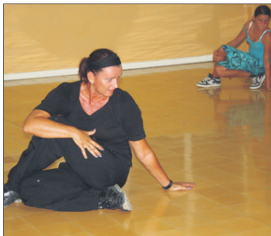
Algreet tijdens een van haar danslessen op Bonaire.

ale levensbehoefte. Het magnetisch veld om haar heen is constant in beweging waardoor ze bewust, maar ook veelal onbewust, de aandacht op zich vestigt. Haar ouders moedigen haar zelfstandigheid aan en staan open voor haar creatieve geest maar in hun tolerante opvoeding geven ze haar ook grenzen. Er passeren roerige tijden waarin ze uren doorbrengt aan het strand met vrienden of achter de computer. Verslaafd aan muziek en msn volgt ze de wisselende hypes via internet. In Soekie-style experimenteert ze met allerhande outfits en laat zich fotograferen door haar vriendinnen. Af en toe loopt ze modeshows of danst tijdens het presenteren van de nieuwe Hippy Chique-collectie op het eiland. Ook werd ze als model gevraagd voor de website van Rossee Bentana. Maar wanneer ze erachter komt dat ze zichzelf kan fotograferen begint ze haar eigen 'modellenbureau'. Ze neemt zichzelf in dienst als fotograaf, kleedster, stylist, visagist en ook als topmodel. Dat doet ze meesterlijk. Het is het begin van een eindeloze collectie foto's die ze deelt via Hyves en Facebook. De reacties van haar vrienden en vriendinnen werken zo stimulerend dat ze zich laat overhalen om mee te doen aan lokale schoonheidswedstrijden. Ze wordt begeleidt door Angelo Domacás die jaarlijks de Mr. en Miss Modelo wedstrijd op het eiland organiseert. Haar Nederlands-Antilliaanse huid is blank en het maakt haar onzeker ten opzichte van de mooie donkere