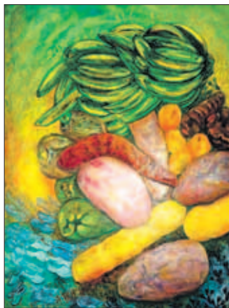
Kleurrijke werken van Asyla ten Holt.