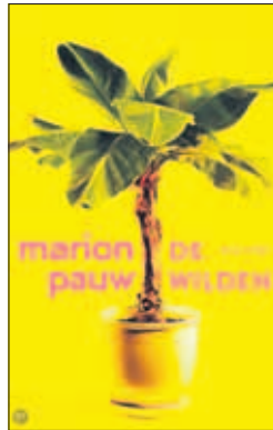
Cover van 'De wilden'.

O p de groenten- en fruitafdeling van een Arubaanse supermarkt staat een tenge-re blonde vrouw. Ze is in gedachten verzonken. Haar gezicht heeft een verrassende, soort van onopvallende, schoonheid. Haar kleding verradert een bezoek aan de sportschool. Met haar intelligente maar meisjesachtige uitstraling zou ze nieuwslezeres kunnen zijn of fotomodel. Of zelfs een hotshot binnen de Caribische jetsset, die overdag langs het strand jogt en 's avonds uitgelezen maaltijden voor haar gasten op tafel zet, nonchalant complimentjes weg-wuivend met flonkerend beringde vingers. Een onberingde hand zweeft over de groente, aarzelend tussen Hollandse of lokale komkommers. Voorover-buigend ruikt ze even aan een bos koriander voordat ze geroutineerd in een aantal tomaten knijpt. Zou ze kok zijn? Per slot van rekening staan tegenwoor-dig ook veel vrouwen commercieel in pannen te roeren. Het is