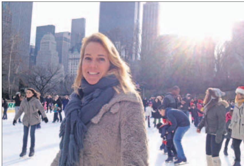
In New York.