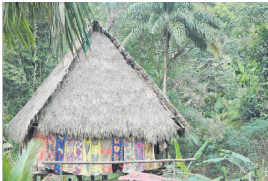
Research voor 'De Wilden' in Panama.