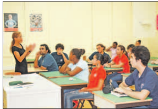
Nabespreking in de klas.