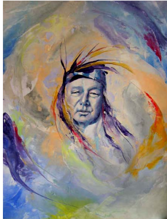
Anton Veldkamp, Linen, mixed mediums, 75x80 cm

aangenomen en ontdek weer een nieuwe waarheid. De kick is dat deze zelden de oude waarheid verwerpt maar juist omvat. Hoe groter de waarheid, des te meer kleinere waarheden hij bevat”.