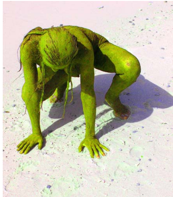
Bon Earth People

Ik zwijg een moment, verdrongen in de golfbeweging van haar gedachten... Even later merk ik op dat ik haar werk erg kleurrijk vind, genuanceerd, haast poëtisch, doelend op haar abstracte werk. Twijfelende, kwetsbare kleuren worden plots geconfronteerd met intense kleurvlakken. Alsof we te maken hebben met een sterk wisselend enjambement in een gedicht. Welke rol, vraag ik, speelt kleur in je leven? "Kleur is een abstracte intelligente taal. Neem eens twee complementaire kleuren, bijvoorbeeld geel en paars. In hun ontmoeting produceren zij samen een soort magie doordat zij tegengesteld zijn aan elkaar. Zij versterken wederkerig elkaars stralingskracht afhankelijk van hun verhouding tot elkaar. Echter wanneer ze (te veel) gemengd worden, gelijk gemaakt worden aan elkaar, vernietigen ze de oorspronkelijke sprankeling van hun verhouding. Kleuren en mensen hebben enorm veel overeenkomsten. Ik leer tijdens het schilderen veel over mijn eigen verhoudingen tot anderen en de wereld".