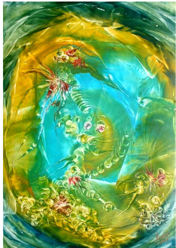
Abstract, Multi coated paper, encaustic, 50x65 cm

schaterlacht en rent de zee in. Humor is een groot goed voor haar. Wanneer ze terug komt, begint ze te ratelen over de boodschap van het water, zout als informatiedrager, sterren, kleuren, Plato en Einstein, verlichting, symboliek, sprookjes en andere dimensies. Ik kan er even geen touw aan vast knopen. Waar haalt ze het allemaal vandaan? Wie is Christel Cosijn?