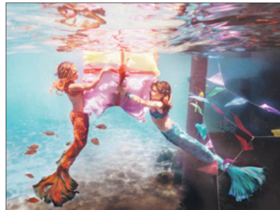
Zeeemmerinnen bij de trap.

Waarom Bonnaire? „Het is het mooist als de foto's echt op een zeelocatie genomen zijn. In december ben ik een week naar Bonnaire gekomen om te kijken of het werkelijk zo schitterend was als het beschreven werd. In die week heb ik een goede onderwatercamera gehuurd zodat ik alvast kon testen of het wel mogelijk was om in zee te fotograferen. Ik heb toen een shoot met mijn zus gemaakt. Ondanks dat ze een aanvaring had met vuurkorale werd het een geslaagde ervaring die naar meer smaakt! Echt een prachtig eiland en helemaal geschikt. Ook de modelletjes doen het goed. Eerst maak ik wat proefshots. In de sprookjes spelen kinderen van 8 tot 11 jaar de hoofdrol. In de ver-