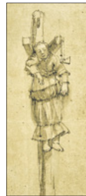
Elsje Christiaens hangend aan de galg (1664).