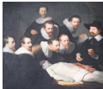
De anatomische les van dr. Tulp (1632).