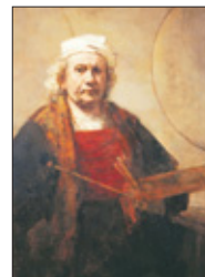
Zelfportret met twee cirkels (ca. 1665-1669).

Mijn tas die ik al steeds van schouder had gewisseld kon eindelijk even af. Het was erg druk en rumoerig. Niet de stille die nodig was om deze kunst te kunnen waarderen. Iedereen zegt wel iets, maar een grapje of legt iets uit over wat er te zien is. Er waren voornamelijk ouderen. Zij lopen naar een schilderij zonder het te bekijken en maken