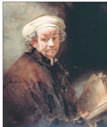
Rembrandt van Rijn, zelfportret (1661).