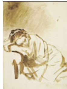
Slapende jonge vrouw (ca. 1654).